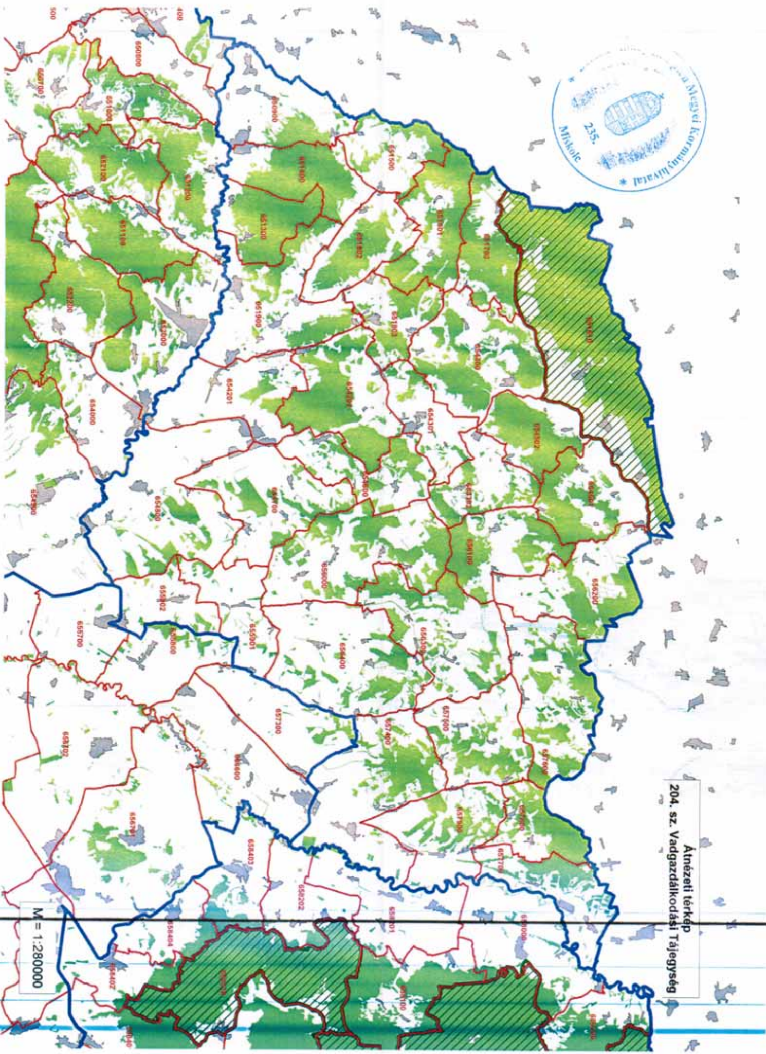
Árnyéki térkép 204. sz. Vadgazdálkodási Tájégség