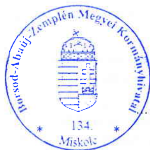
Demeter Ervin kormány megbízott